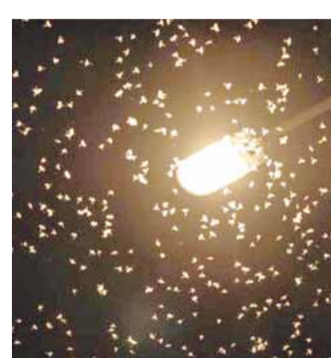
लोग खाना मुश्किल से कर पा रहे हैं।

बरसात का मौसम आते ही तरह तरह के कीड़े-मकोड़ों का आतंक शुरू हो गया है। शाम होते ही बिजली चालू करने पर बल्ब-ट्यूब लाइट के आसपास बड़ी संख्या में कीड़े मंडराने लगते हैं। खासकर नालियों के आसपास लगे विद्युत पोलों में ये कीड़े बड़ी संख्या में दिखाई देते हैं। इन्हें भगाना काफी मुश्किल होता रहा है। लाइट की रोशनी में घंटों तक ये कीड़े उड़ते रहते हैं। कई तरह के कीड़े घरों में प्रकाश देखकर अंदर घुसते हैं जिससे सबसे अधिक परेशानी बच्चों को हो जाती है। कीड़े मकोड़े एवं जीव जंतुओं के काटने की आशंका से घर के बड़े बुजुर्ग भी चिंतित रहते हैं। घर के बाहर लगीं स्टील लाइट्स के आसपास भी छोटे कीड़ों की भरमार रहती है। कई बार कीड़ों की भरमार के चलते उठना बैठना खाना पीना भी कठिन हो जाता है। सबसे ज्यादा झींगुर, पंखीयारी, व काले कीड़े परेशानी का सबब बनते हैं। यदि इनको मारने के लिए दवा का छिड़काव करें तो स्थिति और बिगड़ जाती है। घर में भी